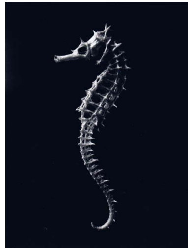
「イバラタツ」2011 248×327 mm ピグメントプリント