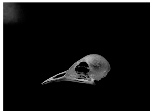
「メジロ」2008 1100×1465 mm ピグメントプリント

hpgrp GALLERY TOKYO は 2014年7月25日より、青山・骨董通りへ移転いたしました。